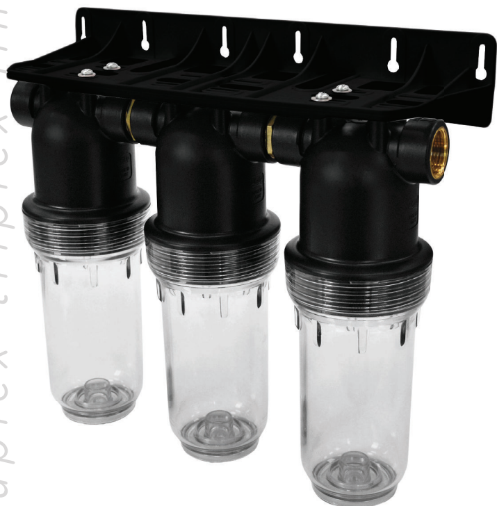
Contenitore per cartucce serie FP2 GIBO TRIPLEX FP2 GIBO TRIPLEX filter cartridge housing

linea duplex-triplex/duplex-triplex line